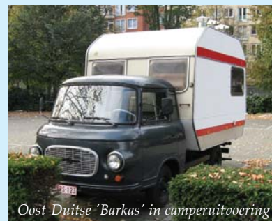
Oost-Duitse 'Barkas' in camperuitvoering