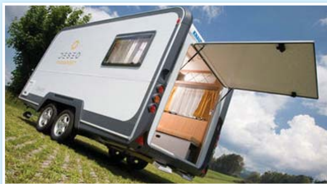
In Noord-Hongarije (Nagyoroszi) geproduceerde caravan van Knaus-Tabbert

voertuig niet als vermist of gestolen staat geregistreerd. Hierbij dient nog de volgende aantekening geplaatst te worden. Caravans met een bouwjaar na 1996 en met een geldig Europees kenteken worden doorgaans zonder problemen in Hongarije geregistreerd. Bij caravans van vóór 1996 gelden strenge controles, waarbij met name gekeken wordt of het voertuig voldoet aan de huidige minimale veiligheidseisen. Ook al heeft de caravan een geldige registratie in Nederland of België, dan nog zou de invoer in Hongarije geweigerd kunnen worden, of men kan bepaalde veiligheidseisen stellen die dienen te worden aangebracht. Het is belangrijk dit in overweging te nemen en zich te beraden of het financieel dan wel interessant is.